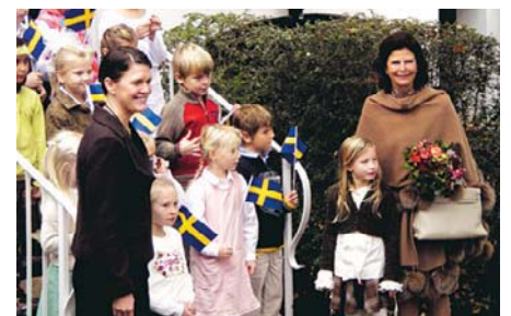
KUNGLIGT FIRANDE. Drottning Silvia, längst till höger, deltog på Svenska klubben i Hamburgs 100-årsjubileum för en månad sedan.