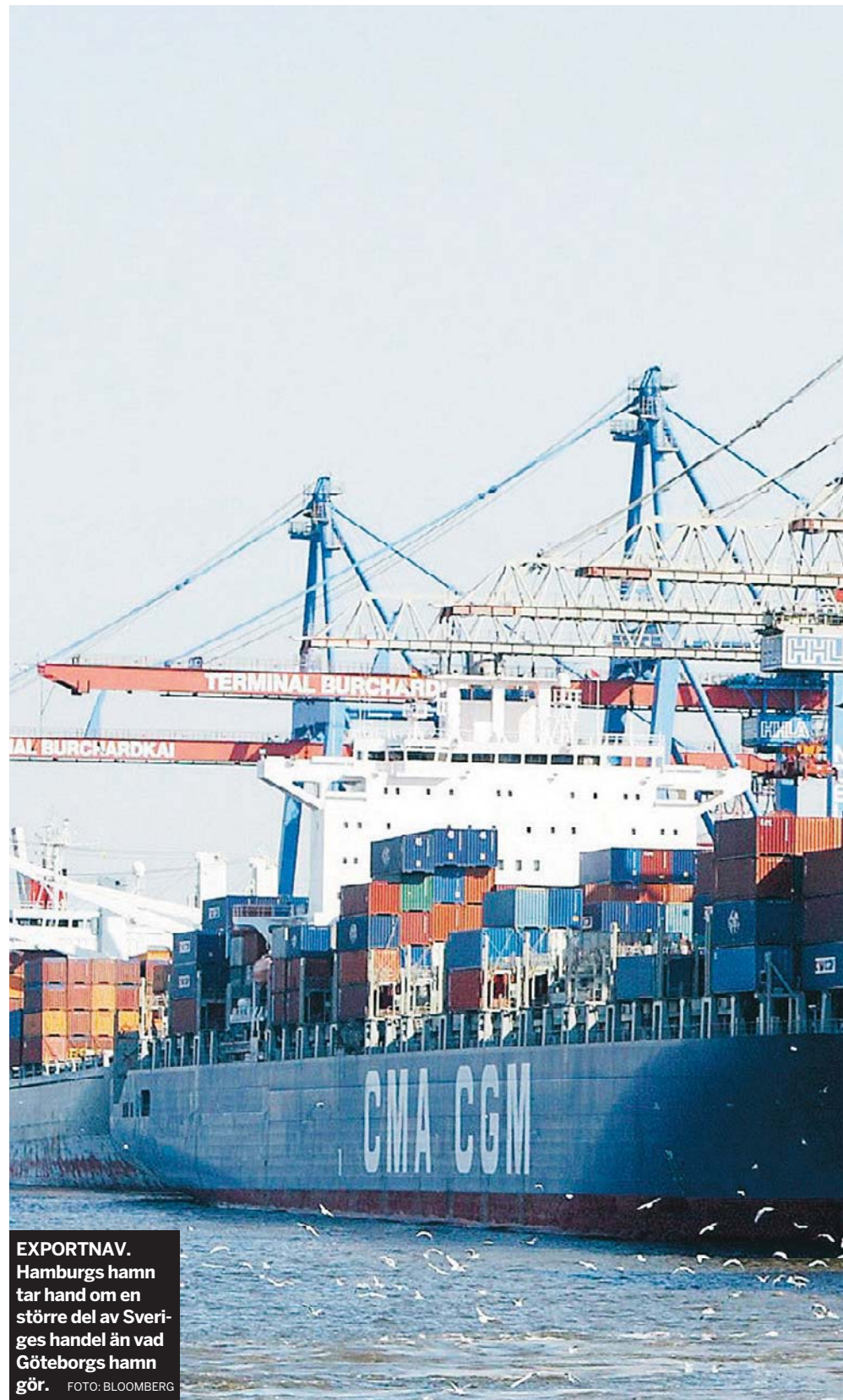
EXPORTNAV. Hamburgs hamn tar hand om en större del av Sveriges handel än vad Göteborgs hamn gör.